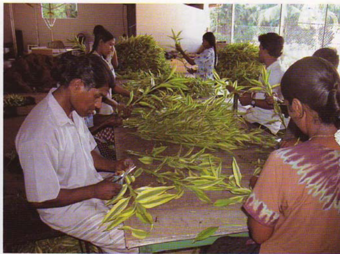
Sortierung und Qualitätskontrolle der Jungpflanzen vor dem Versand. Motiv aus dem Betrieb Green Farms

Erwähnenswert ist auch das im Betrieb installierte Computersystem. Es hält detailliert fest, welche Pflanzenschutzmaßnahmen in welchen Parzellen innerhalb der vergangenen drei Jahre zum Einsatz kamen. Zum einen lässt sich damit analysieren, in welchen Bereichen welche Schädlinge bevorzugt auftreten und eine dementsprechend verstärkte Kontrolle durchge-