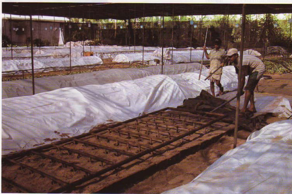
Zur Desinfektion werden die Beete bei Green Farms gedämpft. Der Dampf gelangt über dieses Gestänge in den Boden

Dieses Substrat ist seit sieben Jahren im Einsatz und wird seit zwei Jahren auch in den Mittleren Osten exportiert. Derzeit wird daran gearbeitet, das Substrat unter dem Namen „Bio-Gro“ auch auf dem europäischen Markt einzuführen.