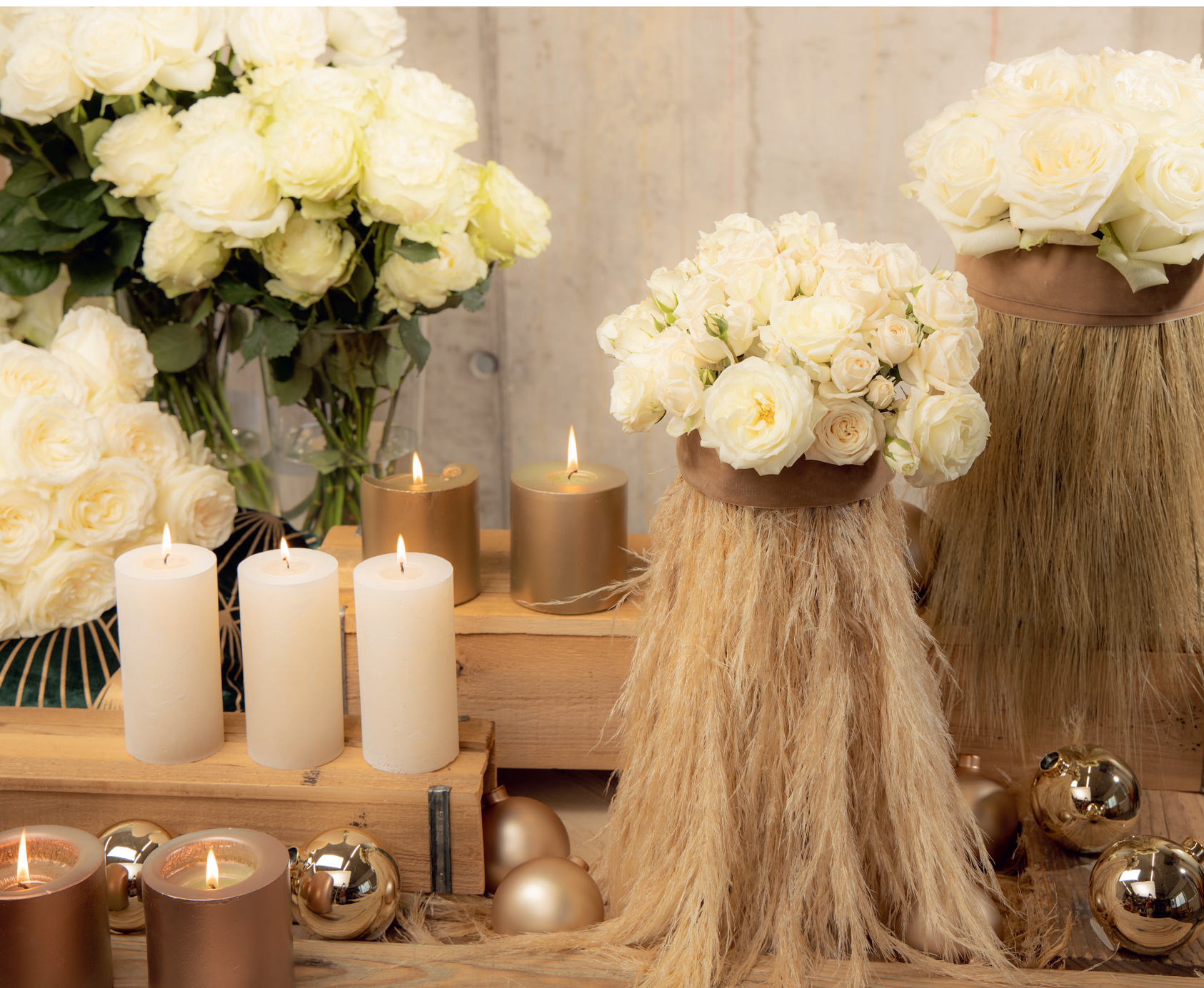
Zum Niederknien schön: Die weissen Rosen-Stars verleihen dem Weihnachtsfest ein höchst glamouröses Ambiente.