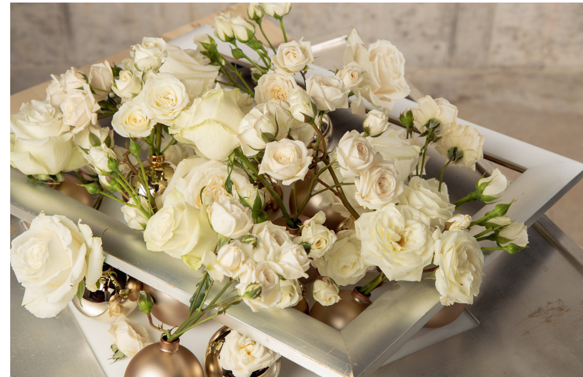
Im Festtagsschmuck präsentieren sich die Rosen besonders anmutig.

Was begünstigt eine hohe Schnittblumenqualität? Sorgfalt, Respekt und eine achtsame Pflege. Kurz gesagt: Liebe. Zum Weihnachtsfest erinnert agrotropic daran, warum es so wichtig ist, Liebe zu verschenken.